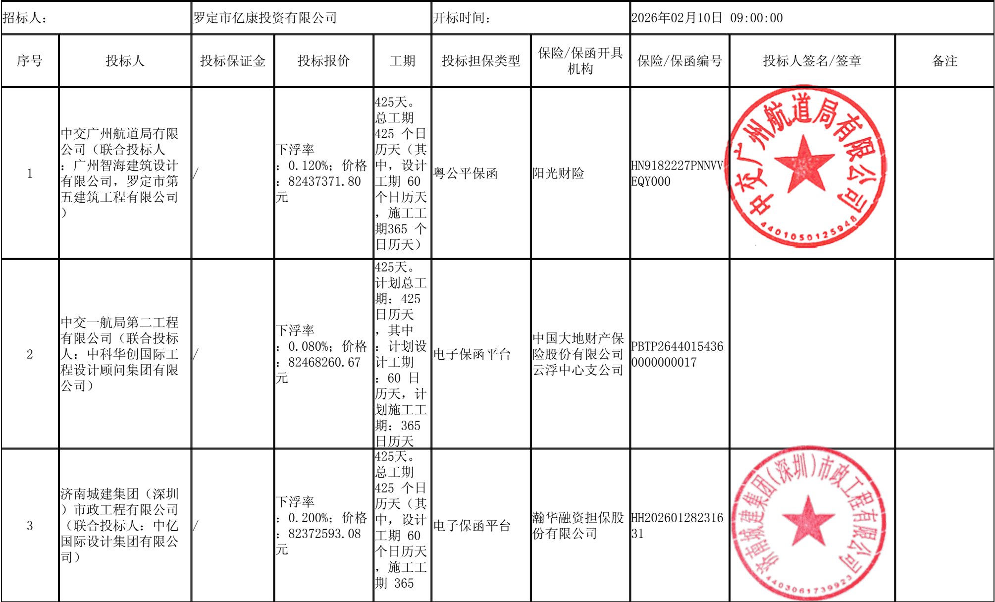
罗定市人民医院新院提升工程（一期）设计施工总承包 开标记录表