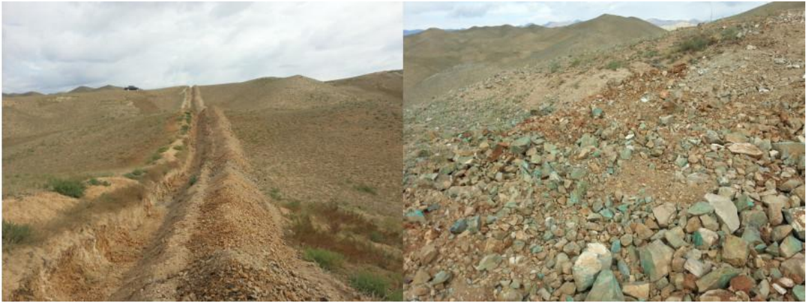
照片 1-2 赫兹塔斯调查评价区地貌及矿化蚀变