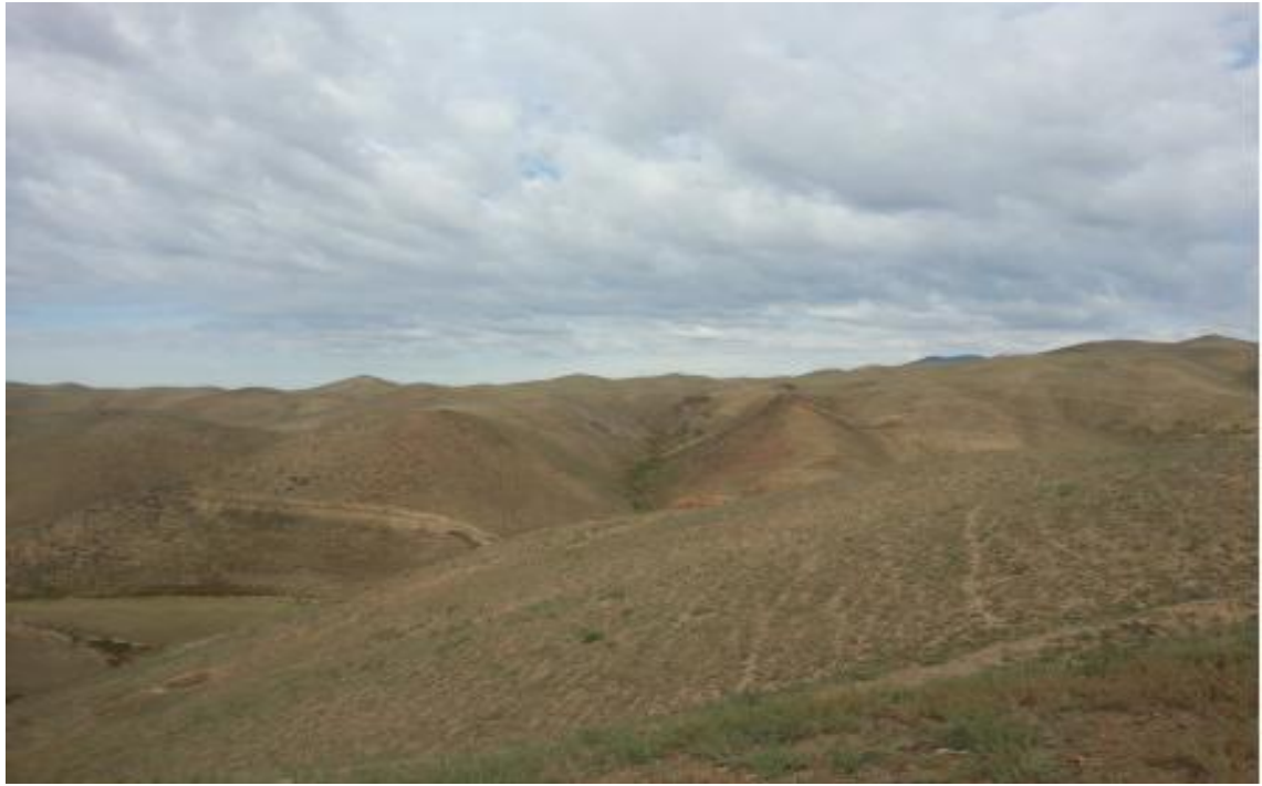
照片 1-1 调查评价区总体地貌