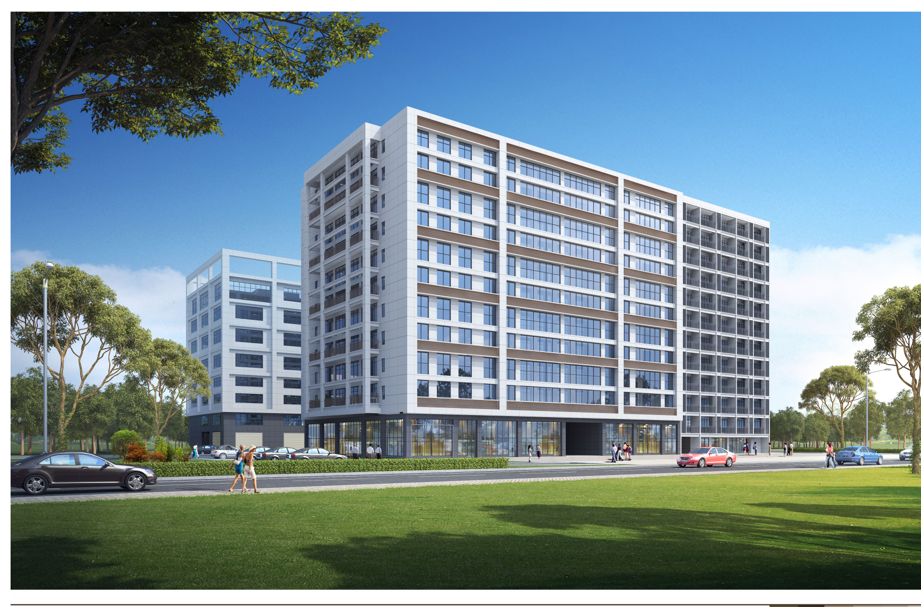
创伟智业项目方案设计