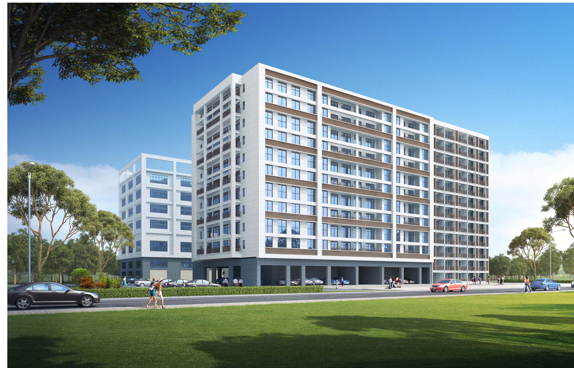
创伟智业项目方案设计