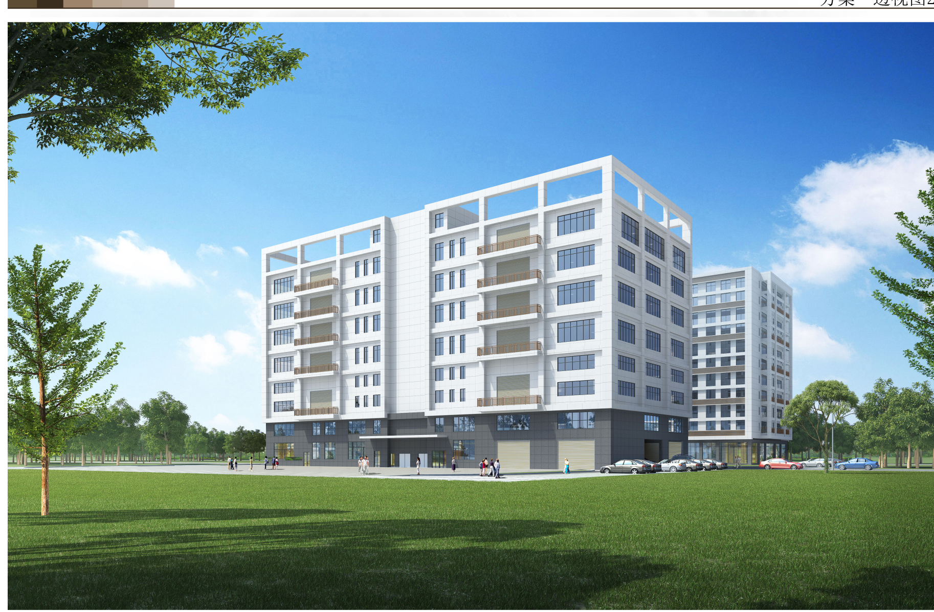
创伟智业项目方案设计