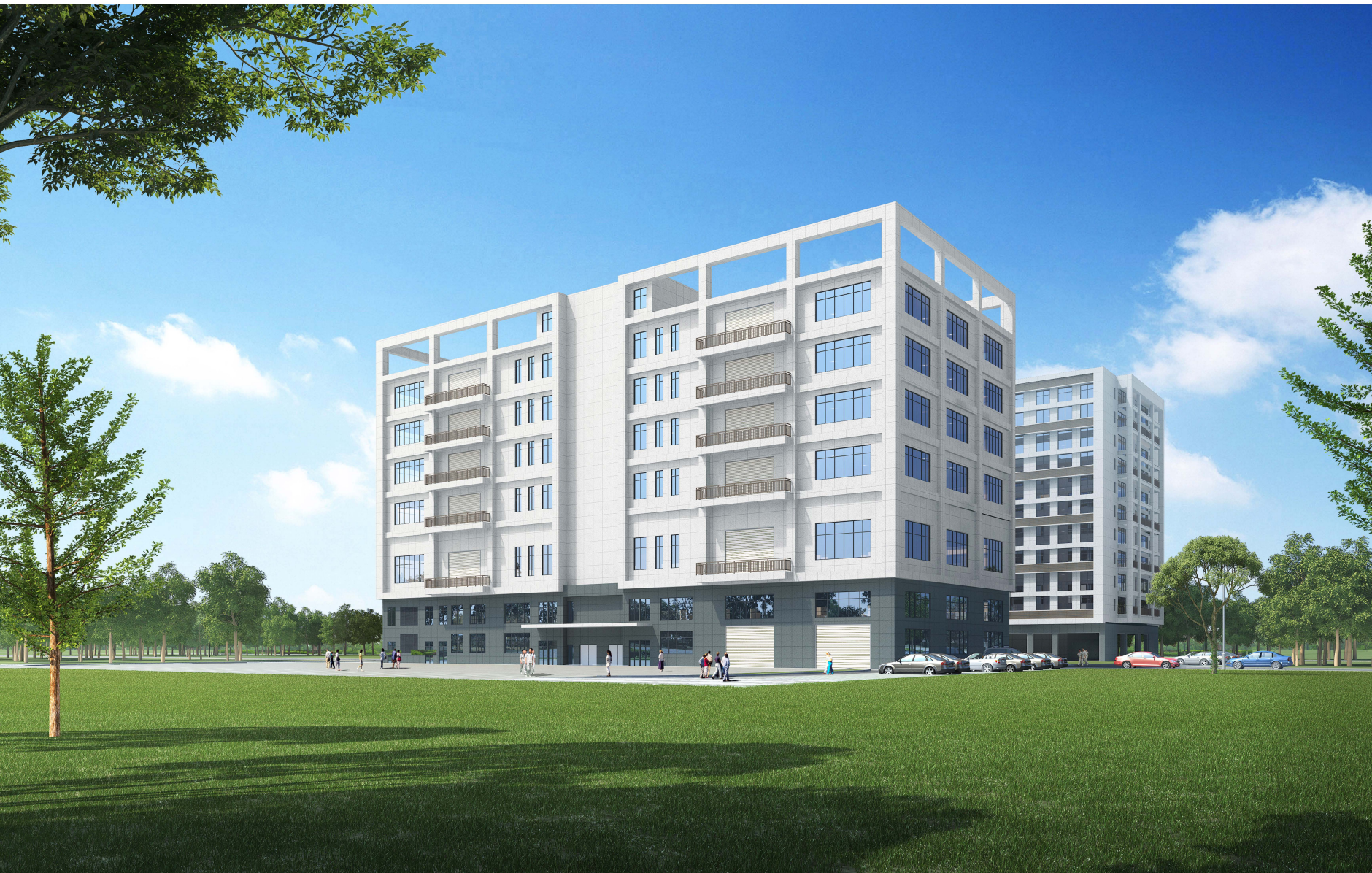
创伟智业项目方案设计