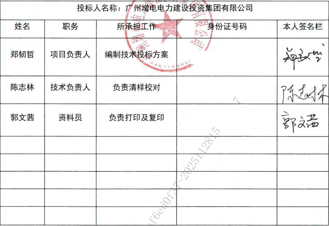
参与编制技术标投标文件人员名单