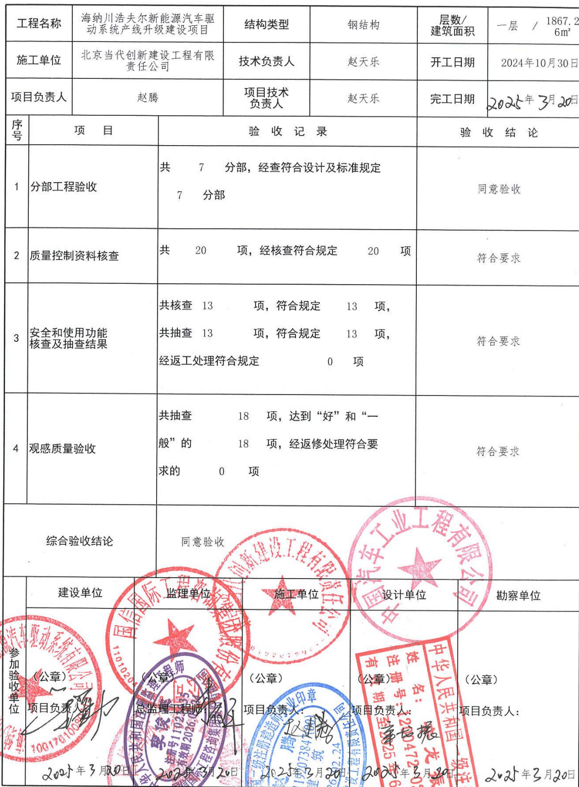
单位工程质量竣工验收记录 表C8-1