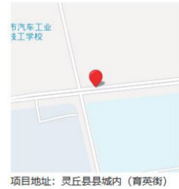
项目地址：灵丘县县城内（育英街）

工程基本信息 招标投标信息 合同登记信息 施工图审查 施工许可 竣工验收 业绩技术指标