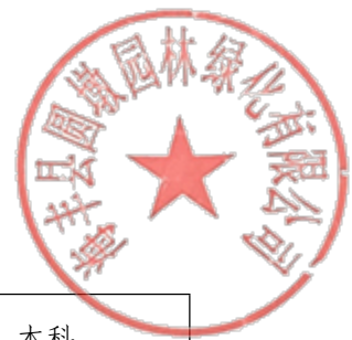
(三) 项目技术负责人简历表