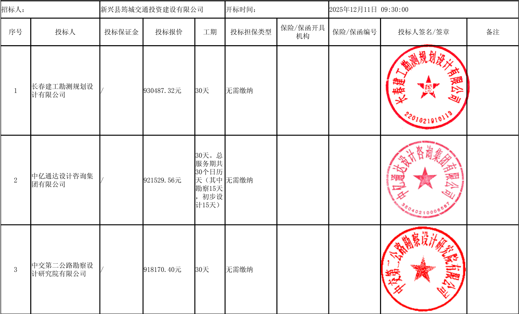
广湛高铁新兴南站综合交通枢纽工程（新兴县太平镇马山至鼎盛大道延长线建设工程）（勘察初步设计） 开标记录表